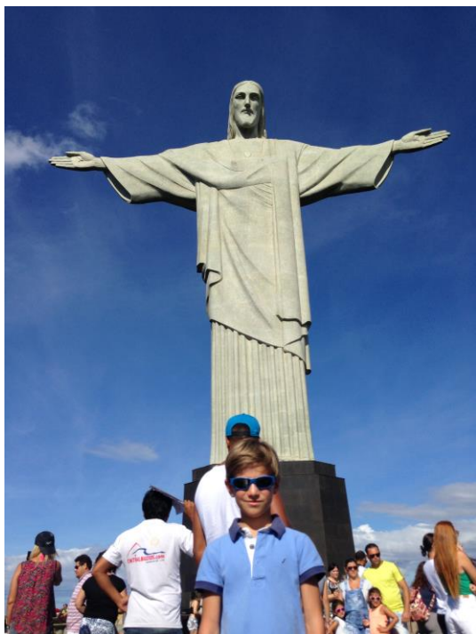
« pose devant la statue du Christ »