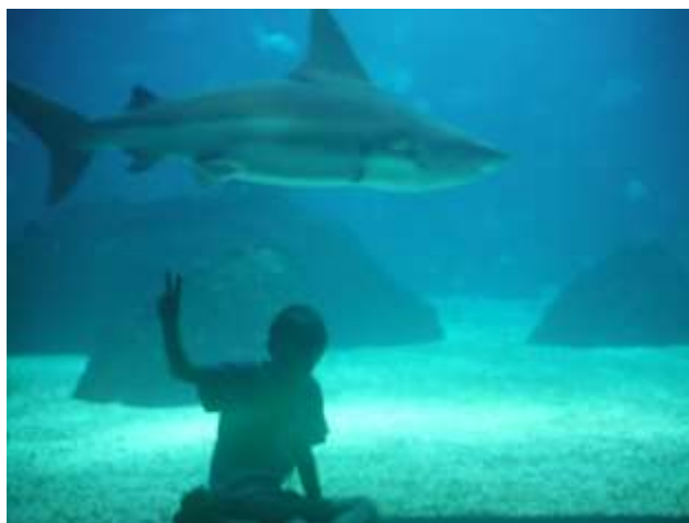
Effrayant ce requin