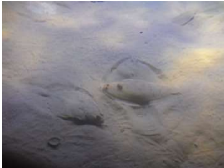
Poissons plats qui se camouflent...